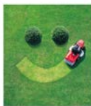
UW TUINMAN VOOR ONDERHOUD EN AANLEG