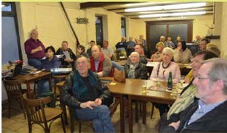
Babbelavond en info Elzas