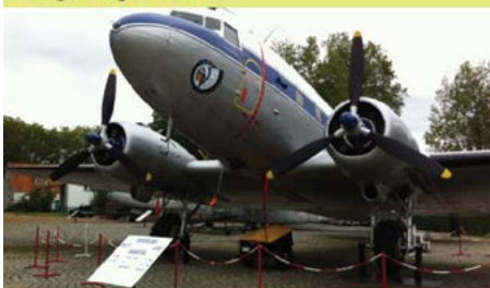
Bezoek 15de Wing