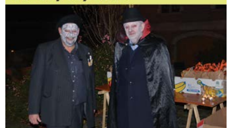
Meester- & Halloweenrit