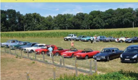
Wie weet da? rit