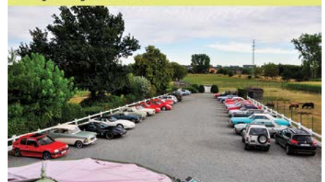
Ritje van de Voorzitter