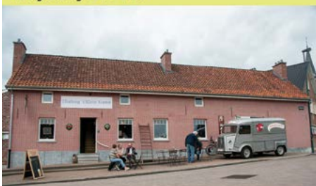
Rit van de vriendschap